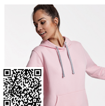
URBAN WOMAN SU1068