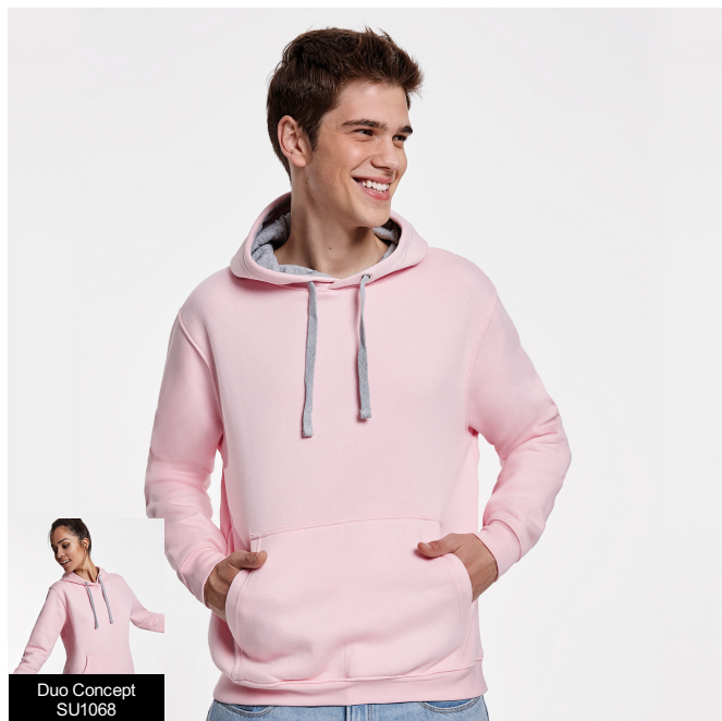
Duo Concept SU1068